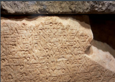
Kalenderinschrift von Priene, 9 v.Chr., Leihgabe: Staatliche Museen zu Berlin – Preußischer Kulturbesitz