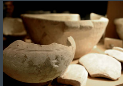
Reinheitsgefäße aus Kalkstein, Leihgabe: Israelische Antikenverwaltung, Jerusalem